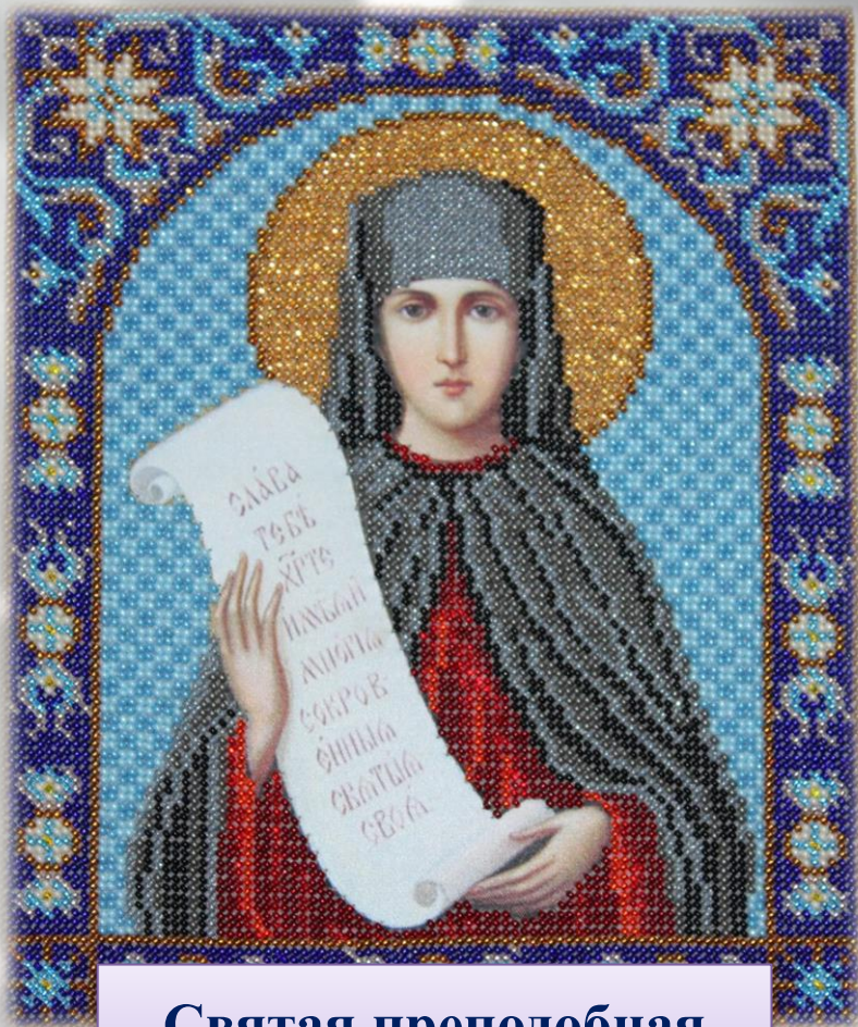
Святая преподобная АПОЛЛИНАРИЯ

На территории нашей страны вышивка бисером существовала ещё в эпоху Древней Руси. Она имела не только эстетическое предназначение, но и являлась оберегом от нечистой силы.