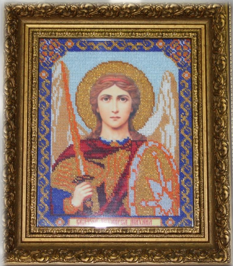
Святой Архангел МИХАИЛ

Для работы необходимо капельку вдохновения, озеро терпения и море желания, а так же: следует запастись всем необходимым для вышивки бисером: