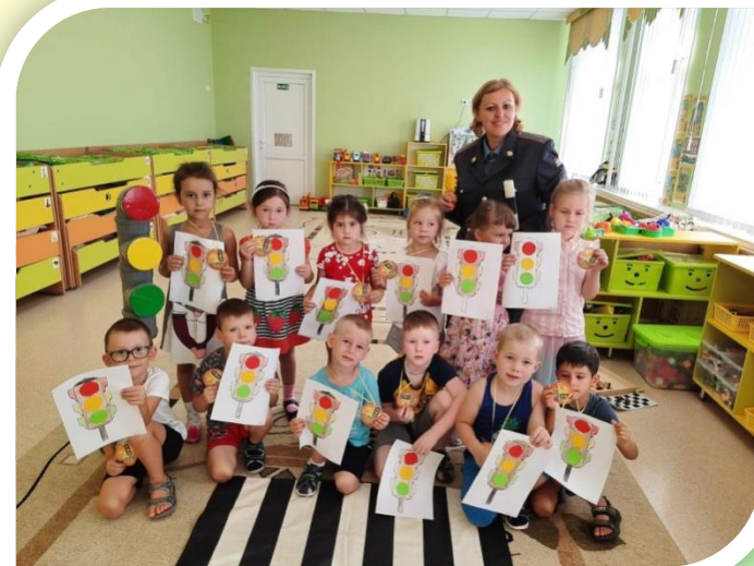
Ситуативная игра «Осторожно, дорога!»