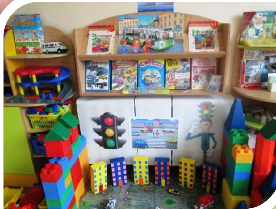
Познавательные центры по ПДД