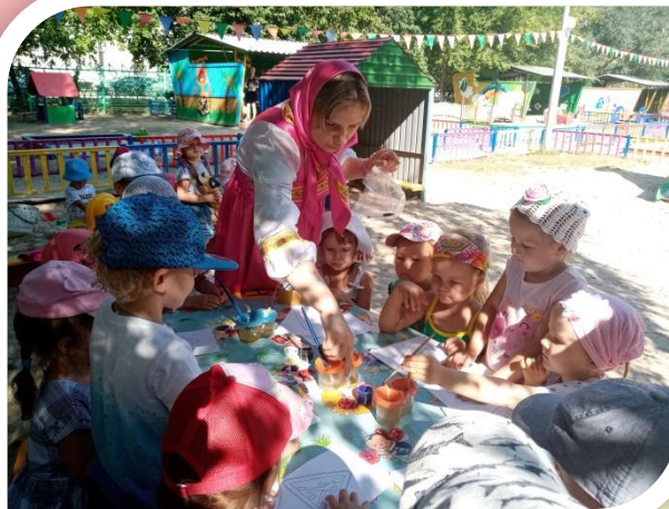
«Путешествие в стану Светофору»