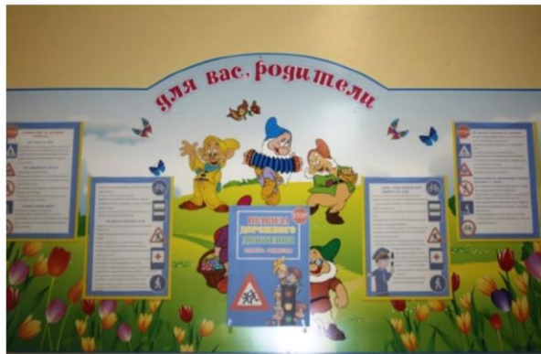
Информационные стенды для родителей по ПДД