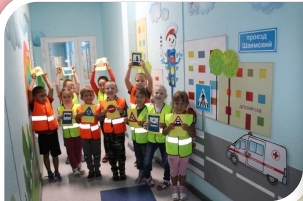
Развивающий стенд в холле д/с