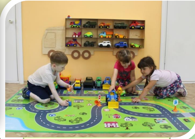
Игровые поля по ПДД