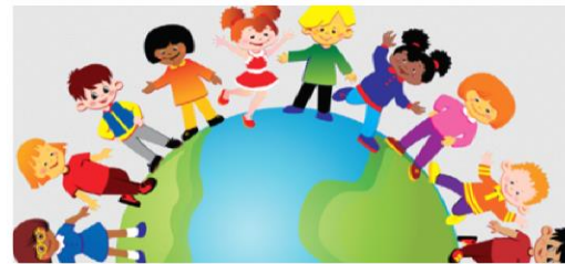
Информация на сайте д/с

Раздел «Новости» http://dsad172.ru/news/