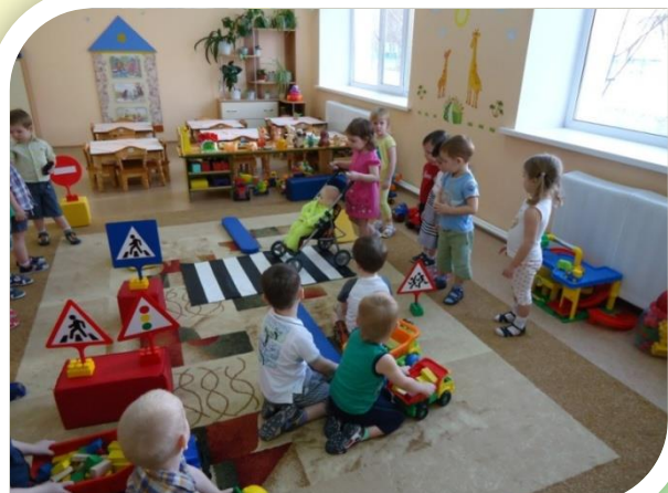
Дидактическая игра «Проезжая часть»

Для стимулирования познавательной активности детей в игре и учебной деятельности по ПДД в группах и холле д/с созданы уголки безопасности