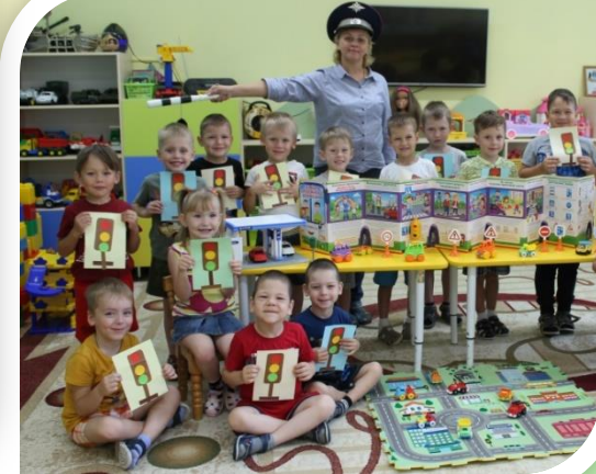
«Наш друг Светофор»