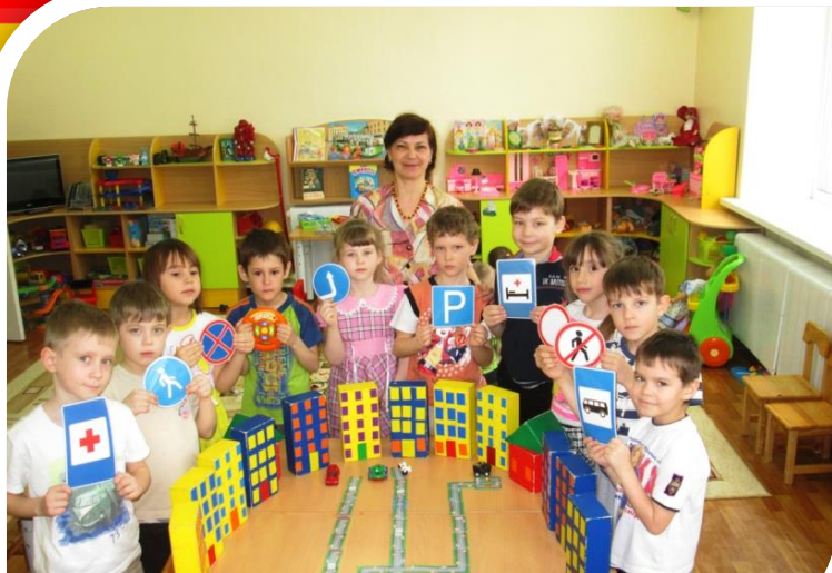
Творческая игра «В стране дорожных знаков!»

В ситуативных и ролевых играх дети разыгрывали самые разнообразные проблемные ситуации: