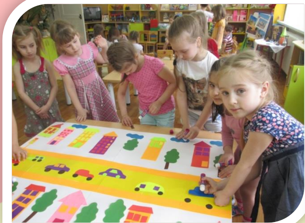
«Улицы нашего города»